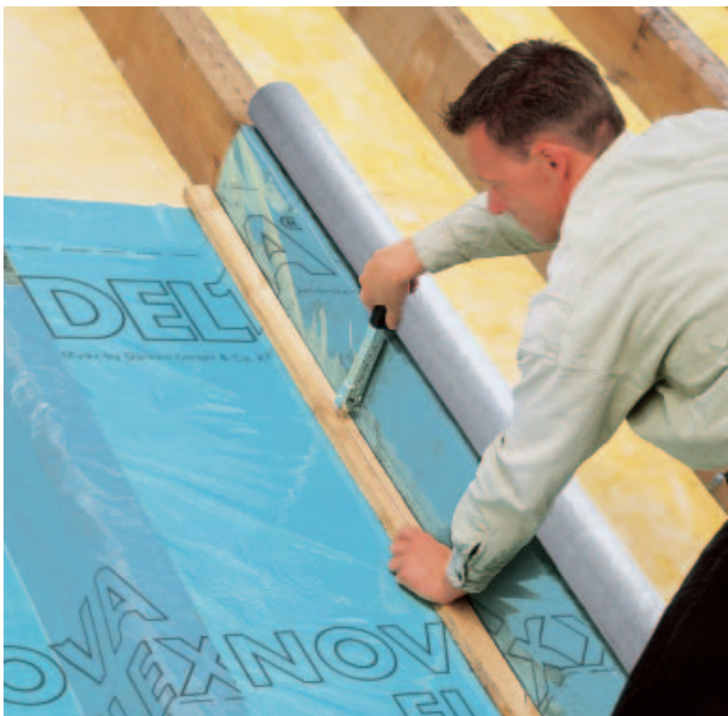
A DELTA®-NOVAFLEXX fektetése a szarufán átvezetve gyors és költségtakarékos.